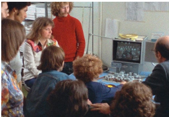
Filmseminar, Princeton, Mai 1974

Eine monumentale Erzählung über die Nürnberger Prozesse und die Folgen. Die Fragen, die den Film durchziehen sind einfach und komplex: Wie ist es möglich, das Verhalten einer Nation oder eines Individuums zu beurteilen? Ist das Urteil einer siegreichen Nation über eine besiegte notwendigerweise heuchlerisch? Und hat Amerikas Grausamkeit in Vietnam nicht seine bei den Nürnberger Prozessen erworbene moralische Integrität beschädigt? Dem Regisseur geht es um die Konkretisierung von Begriffen und Perspektiven. Marcel Ophüls, der in diesem Jahr mit der Berlinale Kamera ausgezeichnet wird, ist einer der bedeutendsten Dokumentaristen des 20. Jahrhunderts. Er ist ein Meister des zielstrebigem Umwegs: Er macht das Einfache komplex und das Komplexe einfach - oft in fast schmerzhafter Gleichzeitigkeit. THE MEMORY OF JUSTICE wurde 1978 im Rahmen der Berlinale präsentiert und galt danach lange als verschollen. Der Film wurde vom Academy Film Archive in Zusammenarbeit mit Paramount Pictures und der Film Foundation sorgfältig restauriert. Das Vorhaben konnte mit Unterstützung der Material World Charitable Foundation, der Righteous Persons Foundation und der Film Foundation realisiert werden.