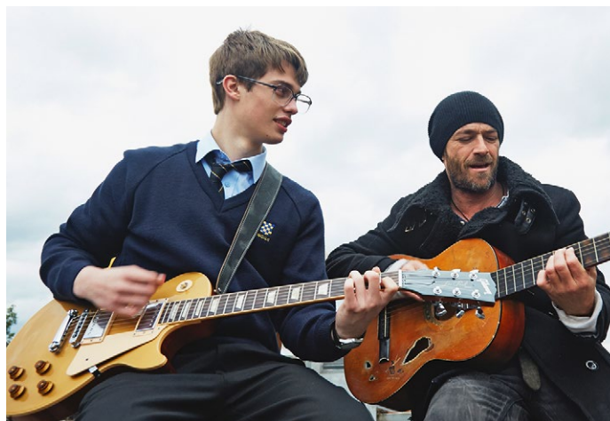
Nicholas Galitzine, Luke Perry

Eines Tages zieht ein Fremder in die Wohnung unter ihnen. Den ganzen Tag dreht er seine schrankgroßen Boxen gnadenlos auf. Der Mann ist skurril und abweisend, doch was Tom da durch die Wände hört, fesselt ihn. Er findet heraus, dass es sich bei dem Sonderling um eine Legende handelt: Max Stone, vor 20 Jahren gefeierter Gitarrist der Band Nothing. Es heißt, er sei auf mysteriöse Weise ums Leben gekommen. Hier lebt er unter falschem Namen, um seiner Steuerschuld zu entkommen. Tom wittert seine Chance und droht Max, ihn zu verraten, wenn er ihm nicht alles über Musik beibringt. Ungern willigt Max ein, freundet sich aber bald mit seiner neuen Lehrerrolle an. Denn dieser komische Junge hat tatsächlich Talent.