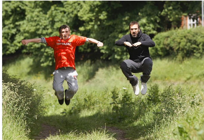
Steve Evets, Eric Cantona

Eric Bishop scheint erledigt. Seine Ehefrau hat ihn verlassen, die beiden Stiefsöhne tanzen ihm auf der Nase herum, und auch seinem Beruf ist der Postbote aus Manchester nicht mehr gewachsen. Aufmunterungsversuche seiner Kollegen scheitern kläglich. Doch dann erscheint ihm nach einem Joint sein großes Idol, der Fußballer Eric Cantona, und versorgt ihn mit Ratschlägen, die bewirken, dass Eric sich dem Leben endlich doch noch stellt. Nicht nur findet er Kontakt zu seiner ersten Ehefrau, die er 30 Jahre zuvor schmachlich im Stich ließ. Eric nimmt es auch mit dem Gangsterboss auf, der seine Söhne unter seiner Knute hat, wobei ihm zwei Dutzend Manchester-United-Fans schlagkräftig zur Seite stehen ... Mit seinem „Feel-good Movie“ überrascht Loach zwar zwar formal, thematisch aber bleibt er sich treu. Im gelungenen Doppelpassspiel seines Underdog-Protagonisten mit dem einstigen Stürmer-Star offenbart sich einmal mehr das Vertrauen des Regisseurs auf solidarische Stärke und egalitäre Strukturen im Kampf der Arbeiterklasse – nur dass er hier deren Akteure bei ihrer direkten Aktion als Kollektiv aus vielen Cantonas maskiert und damit als Adepten einer populären Unterhaltungskultur tarnt.