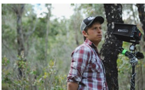
Jonathan auf der Heide FOG Drehbuch: Jonathan auf der Heide Kamera: Ellery Ryan Schnitt: Billy Browne

Für die Leinwandadaption von Tim Wintons populären Kurzgeschichten wurden 18 renommierte australische Künstler – Regisseure, Schauspieler, Animationsfilmer und Performer – hinter die Kamera geholt. Jeder von ihnen entdeckt und interpretiert die lyrischen Erzählungen des bekannten australischen Autors auf persönliche Weise für das Kino neu. Schauplatz ist Angelus, eine Kleinstadt an der australischen Westküste. Untrennbar sind die Lebenslinien der Bewohner mit der archaischen Landschaft um sie herum verbunden. Die miteinander verwobenen Geschichten erzählen aus dem Alltag ganz gewöhnlicher Menschen, die sich gerade an einem Wendepunkt ihrer Biografie befinden. Das Vergehen der Zeit, die Fehler der Vergangenheit, Abhängigkeit und Besessenheit sind wiederkehrende Motive. Immer wieder begegnet man auch dem rätselhaften Vic, seiner eigenwilligen Familie und seinen diversen Freunden. Die Episoden sind mal melodramatisch, mal nüchtern und sachlich, mal leicht und dann wieder ernst gehalten. Auch durch die unterschiedlichen Handschriften befindet sich der Zuschauer in einem permanenten Wechselbad der Gefühle.