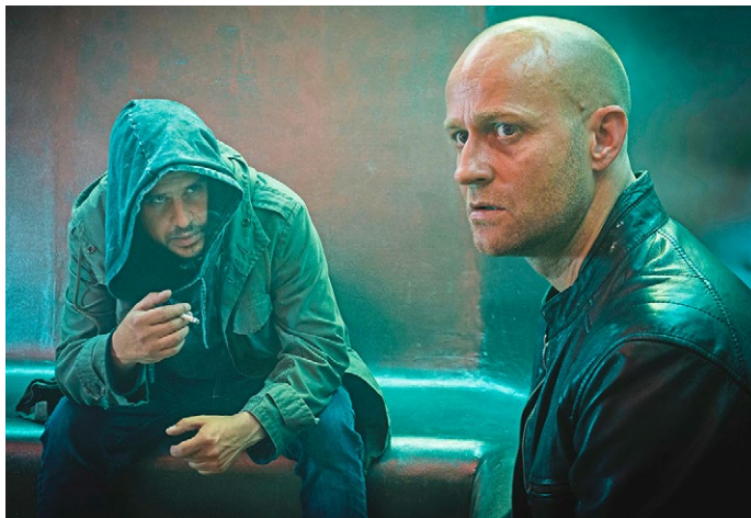
Moritz Bleibtreu, Jürgen Vogel