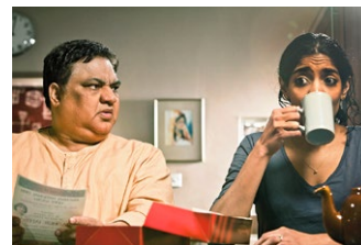
JADOO Großbritannien 2012 Regie: Amit Gupta Mit Amara Karan, Harish Patel, Kulvinder Ghir, Tom Mison, Madhur Jaffrey