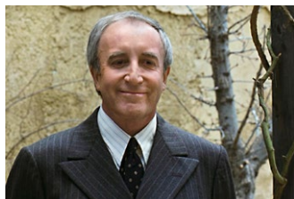
BEING THERE (Willkommen, Mr. Chance) USA 1979 Regie: Hal Ashby Mit Peter Sellers, Shirley MacLaine, Melvyn Douglas, Jack Warden