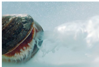
L' AMOUR DES MOULES (Mussels in Love) Niederlande/Belgien 2012 Regie: Willemiek Kluijfhout Dokumentarfilm