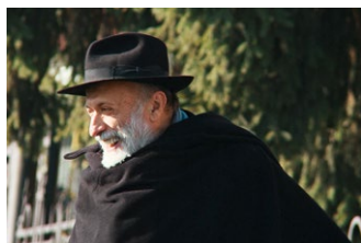
SLOW FOOD STORY Italien 2013 Regie: Stefano Sardo Dokumentarfilm

Ein Garten ist ein Ort, abgeteilt von der Natur und der Kunstwelt der Häuser und Straßen, ein Zwischenraum. Auch der Film besteht aus Zwischenräumen, aus Einzelbildern, die einen Teil der Welt einrahmen und die Zeit in normalerweise 24 Bilder pro Sekunde unterteilen. In diesen zeitlichen und räumlichen Grenzen haben wir die Möglichkeit, das Große im Kleinen zu verstehen – to search for large meanings in small things (Michael Pollan). In einer Zeit der globalen Industrialisierung gewinnt der Garten als Gegenmodell für Ernährung, Schule und Erholung wieder an Bedeutung.