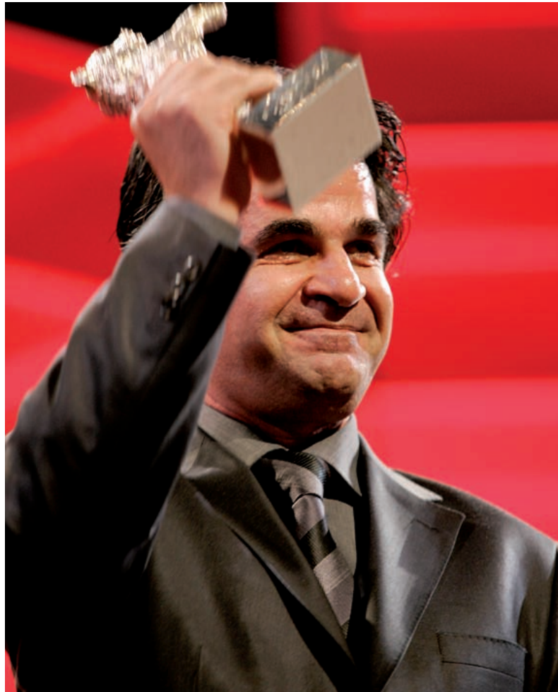
Jafar Panahi, Berlin 2006