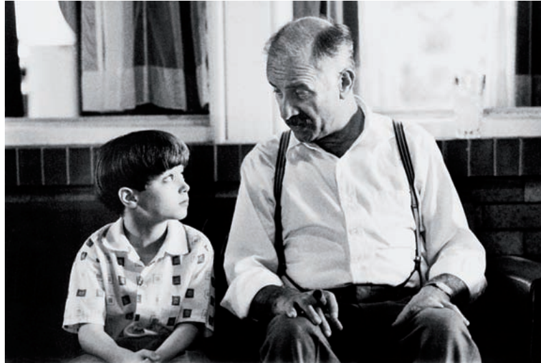
Elijah Wood, Armin Mueller-Stahl

Né le 6-4-1942 à Baltimore, Maryland. Y travaille à la télévision pendant ses études puis suit des cours d'art dramatique à Los Angeles. Devient comédien et scénariste. Réalise en 1982 son premier film, AMERICAN DINER, suivi d'autres œuvres autobiographiques (LES FILOUS, AVALON, LIBERTY HEIGHTS). Oscar du meilleur réalisateur en 1989 pour RAIN MAN. Participe ensuite à la compétition de la Berlinale avec BUGSY (1992), JOUETS (1993) et DES HOMMES D'INFLUENCE (1998).