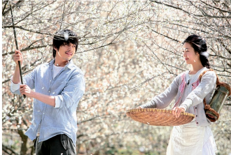
Lee Dong-wook, Lee Yo-won