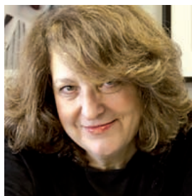
Lynn Hershman Leeson

L'artiste américaine Lynn Hershman Leeson se consacre à l'art médiatique depuis les années 70. Elle a maintenant visionné et condensé plusieurs centaines d'heures d'interviews et de conversations enregistrées avec des collègues, des amis, des historiens d'art, des commissaires d'exposition et des critiques pour en faire un singulier film documentaire qui retrace l'histoire du Feminist Art Movement. La réalisatrice disposait pour cela de documents filmés au cours de 42 années qui donnent un aperçu fascinant de la diversité et de l'énergie de l'art féministe. Elle parvient dans son travail à conserver son approche subjective sans escamoter la complexité et le caractère contradictoire qui font précisément la richesse de ce mouvement et de ses protagonistes. Les interviews avec de jeunes artistes ouvrent un dialogue au-delà des frontières entre les générations. La description des perspectives diverses et sujettes à l'évolution des personnes interrogées explicite les acquis tout comme les erreurs du mouvement artistique. La ténacité et le courage des artistes présentées dans le film et de leurs œuvres illustrent bien ce dont sont persuadés de plus en plus d'historiens d'art : le « Feminist Art Movement » fait partie des mouvements artistiques les plus marquants du XXe siècle.