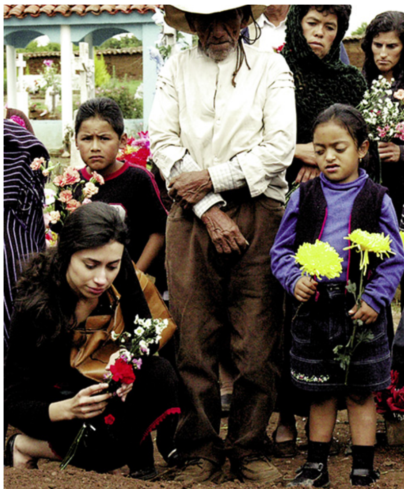
LINDO Y QUERIDO, Regie: Patricia Riggen

Réalisateur de l'épisode R-100. Invité en 2006 à Cannes avec THE GOOD TIMES KID et en 2008 au festival de Venise avec I'M GONNA EXPLODE.