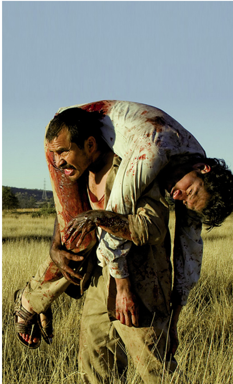
R-100, Regie: Gerardo Naranjo

Réalisatrice de l'épisode LA TIENDA DE RAYA. Réalise en 2008 son premier film, CINCO DÍAS SIN NORA.