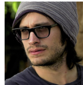
Gael García Bernal

Réalisatrice de l'épisode LINDO Y QUERIDO. Réalise en 2007 son premier long métrage de fiction, LA MISMA LUNA.