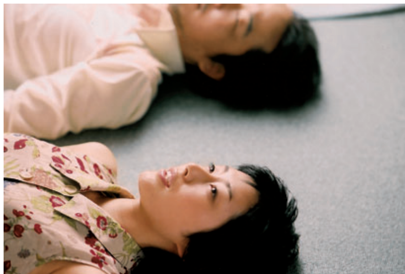
Lily Franky, Tae Kimura