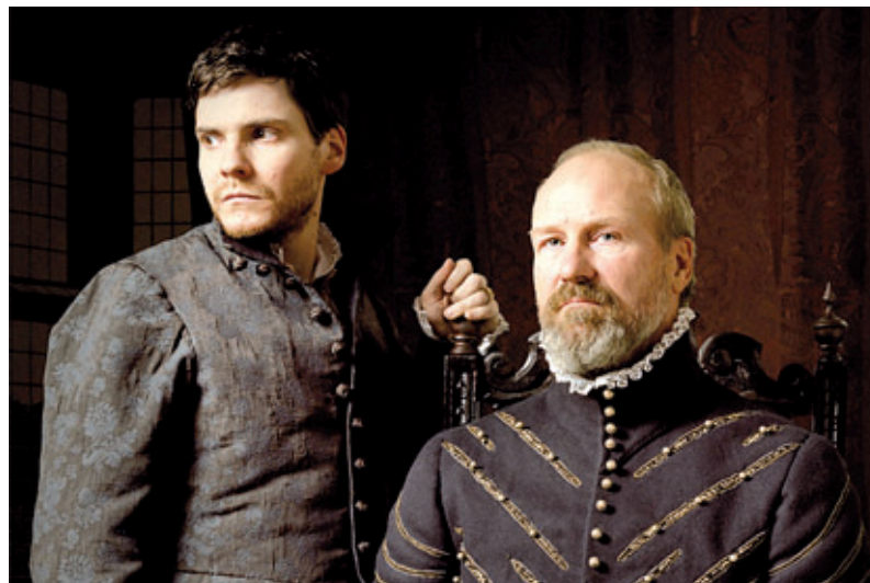
Daniel Brühl, William Hurt

La véritable Erzebet Bathory naquit en 1560 d'une lignée de comtes influents. Encore enfant, on la maria à un comte hongrois qui lui fit cinq enfants. Sa richesse et la grande influence de sa famille justifient les doutes émis dans les années 1980 au sujet du procès de 1610 au cours duquel des domestiques avouèrent sous la torture que leur maîtresse était responsable de la mort de plus de 150 jeunes filles. Trois de ses domestiques furent condamnés à mourir sur le bûcher, elle-même fut assignée à résidence dans un château jusqu'à sa mort en 1614. Au 19ème siècle, son histoire inspira de nombreuses œuvres littéraires.