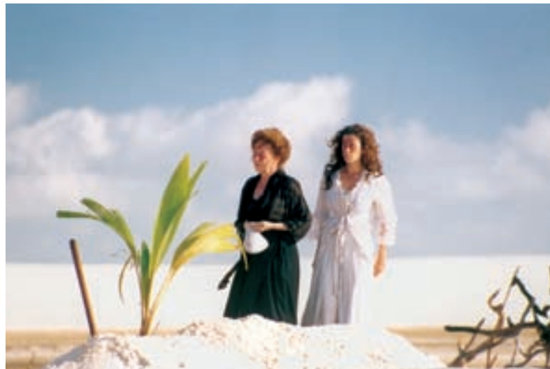
Fernanda Montenegro, Fernanda Torres

Weltvertrieb Fortissimo Films Veemarkt 77-79 NL-1019 Amsterdam Tel.: 20-627 32 15 Fax: 20-626 11 55 marnix@fortissimo.nl