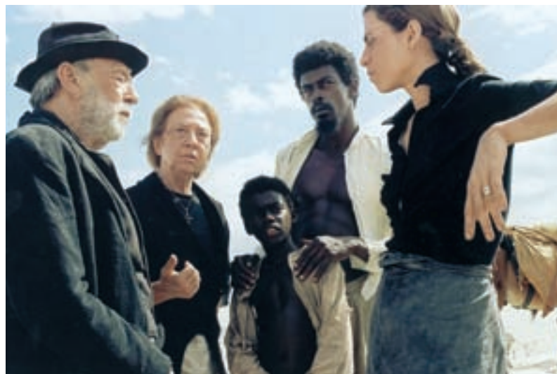
Emiliano Queiroz, Fernanda Montenegro, Seu Jorge, Fernanda Torres

Son désir de partir dans le vaste monde survit chez sa fille. La jeune Maria va se rebeller contre la solitude de leur existence en menant une vie désordonnée, voire débauchée, mais elle ne se libérera jamais complètement des sables de Maranhão.