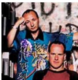
Randy Barbato, Fenton Bailey