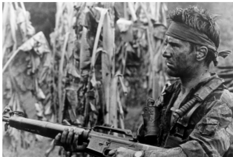
Robert De Niro