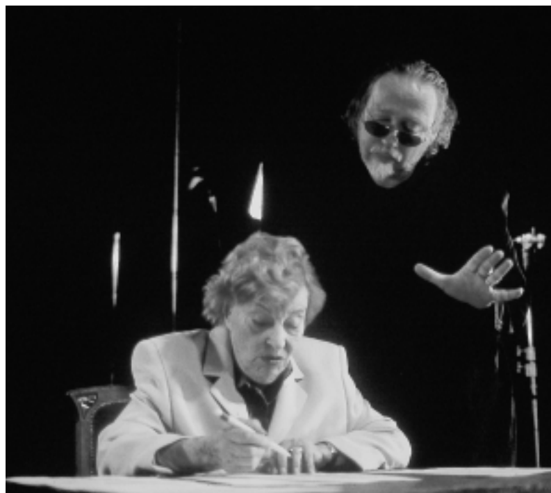
Marianne Hoppe, Werner Schroeter

Né en 1945 à Georgenthal, Thuringe. Tourne ses premiers films expérimentaux en 8mm en 1967/68, puis à partir de 1969, des longs métrages souvent mélodramatiques s'inspirant d'opéras, ou bien des farces critiquant la société de l'époque, ainsi que des documentaires. Depuis 1972, également metteur en scène de théâtre et d'opéra en Allemagne et à l'étranger. En 1996, on lui décerne au Festival de Locarno un « Léopard d'Honneur » pour l'ensemble de son œuvre.