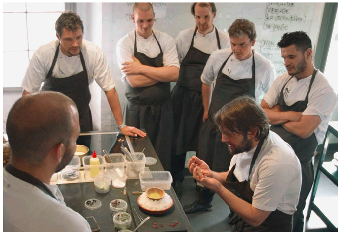
René Redzepi und seine Köche