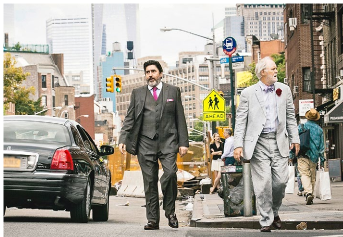
Alfred Molina, John Lithgow

Nachdem im Juni 2011 die Homo-Ehe in New York legalisiert wird, heiraten Ben und George nach 39 gemeinsamen Jahren. Als daraufhin Georges Musiklehrerstelle an einer katholischen Schule fristlos gekündigt wird, verlieren sie ihre Wohnung in Chelsea. George kommt bei einem benachbarten schwulen Polizisten-Paar unter, Ben wird von der Familie seines Neffen in Brooklyn aufgenommen. Gereizte Rücksichtnahme, nagende Missstimmung, räumliche Übergriffe und keimende Zukunftsängste stellen die Freundschaften in den neuen Wohngemeinschaften immer wieder auf die Probe. Beeindruckend beiläufig entwickelt Regisseur Ira Sachs mit seinen Stars die Geschichte einer von homophoben Strukturen in der Umwelt verantworteten Existenzberaubung zu einer einfühlsamen Partnerschaftsstudie: Mit großer Hingabe verleihen Alfred Molina und John Lithgow der tiefen Verbundenheit zwischen George und Ben eine berührend zärtliche Unbeschwertheit und erschaffen ein Paar, das selbstherrlich regierender Behäbigkeit mit entwaffnender Zuversicht begegnet und sich und uns mit seiner Liebe verzaubert.