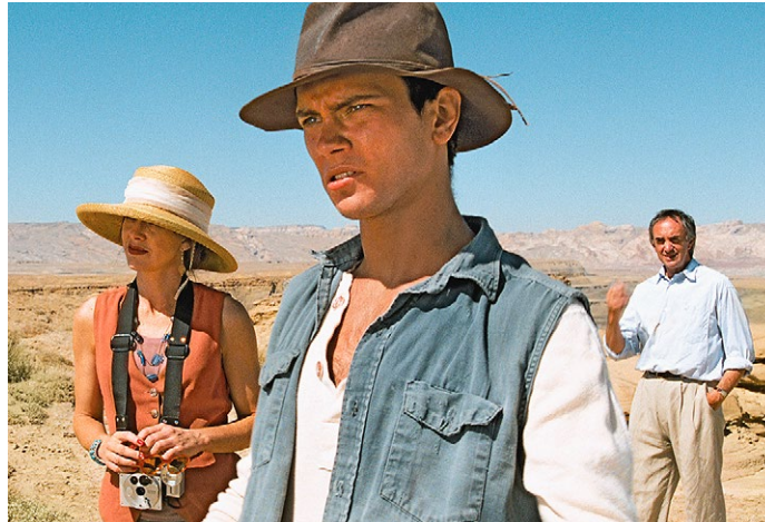
Judy Davis, River Phoenix, Jonathan Pryce

Nach dem plötzlichen Tod des Hauptdarstellers River Phoenix zehn Tage vor Abschluss der Dreharbeiten 1993 fiel das Filmmaterial zu DARK BLOOD an die Versicherung, die für den Drehabbruch aufkam. Jahre später konnte Regisseur George Sluizer das Material vor der endgültigen Vernichtung bewahren. Im Januar 2012 begann er mit der Endfertigung seines Films, wobei er sich entschloss, die fehlenden Szenen im Off aus dem Drehbuch vorzulesen. Sein Film ist ein existenzialistischer Spätwestern von suggestiver Kraft, die nicht zuletzt von der Präsenz seiner am Rande des Todes balancierenden Hauptfigur ausgeht.