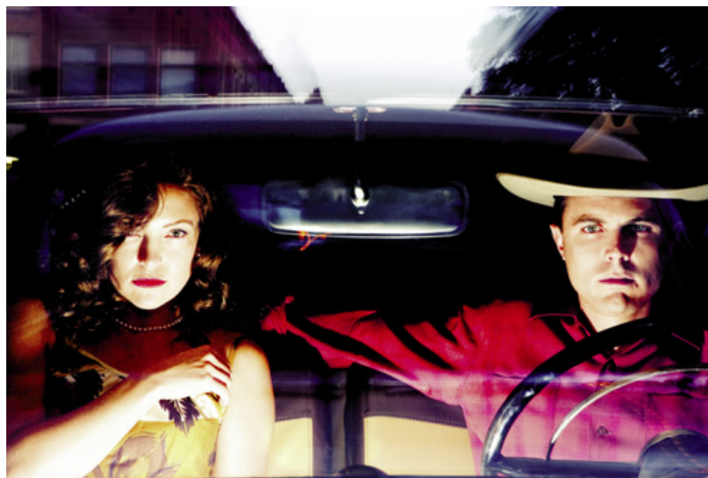
Kate Hudson, Casey Affleck

Weltvertrieb Wild Bunch 9, rue de la Verrerie F-75004 Paris Tel.: +33 1 53015032 edevos@wildbunch.eu