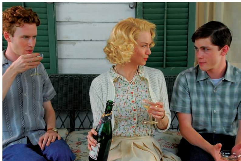
Mark Rendall, Renée Zellweger, Logan Lerman