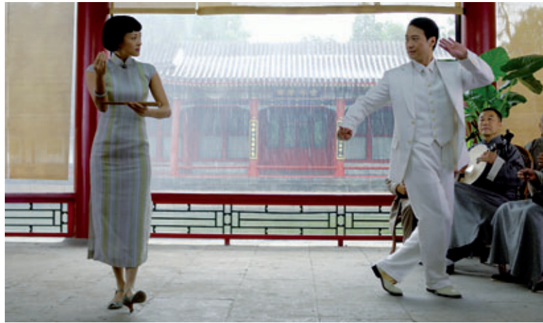
Zhang Ziyi, Leon Lai