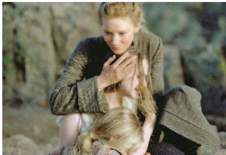
Cate Blanchett, Evan Rachel Wood, Jenna Boyd

Ron Howard : « Le film retrace la chronique d'hommes et de femmes imparfaits qui font toutefois preuve d'un immense courage lorsqu'ils sont confrontés à une indicible horreur. C'est une histoire de guérison et de réconciliation qui présente toutefois aussi les revirements inattendus d'un thriller. »