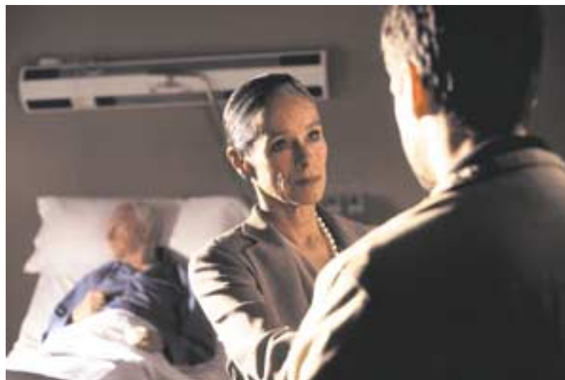
Fernando Fernán Gómez, Geraldine Chaplin, Leonardo Sbaraglia

Weltvertrieb Sogepaq Gran Vía, 32, 1º E-28013 Madrid Tel.: +91-524 72 20 Fax: +91-521 08 75 edixerx@sogepaq.es