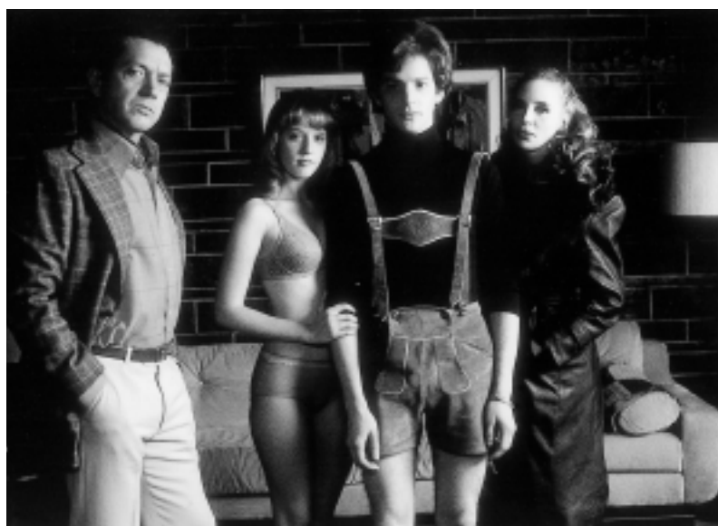
Bernard Giraudeau, Ludivine Sagnier, Malik Zidi, Anna Thomson